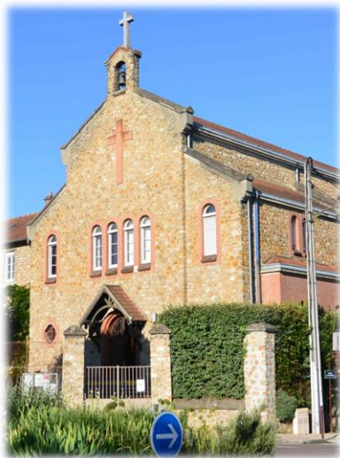
Chapelle Saint Joseph