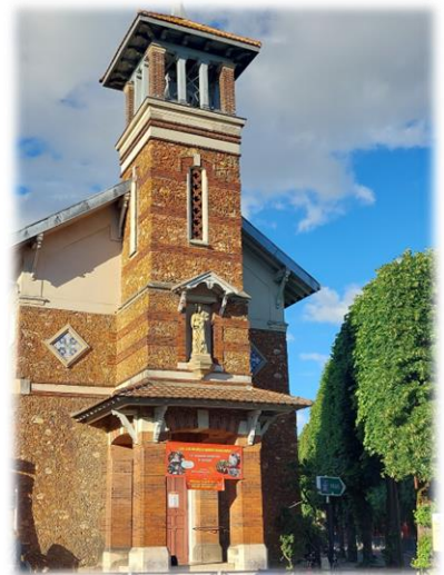
Salle Sainte Marie