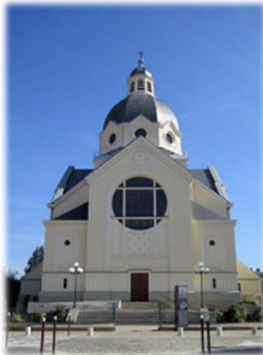
Eglise Sainte Jeanne d'Arc